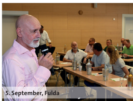
5. September, Fulda