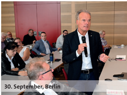
30. September, Berlin