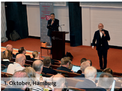
1. Oktober, Hamburg