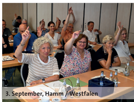
3. September, Hamm / Westfalen