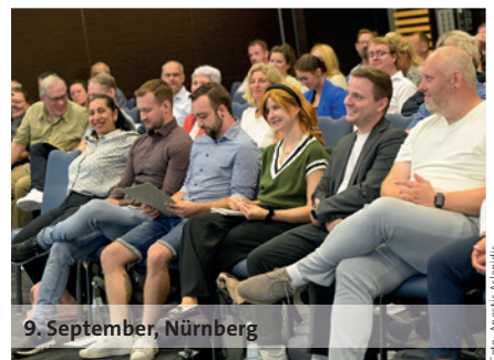
9. September, Nürnberg