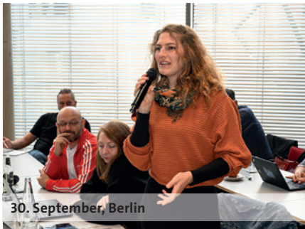
30. September, Berlin