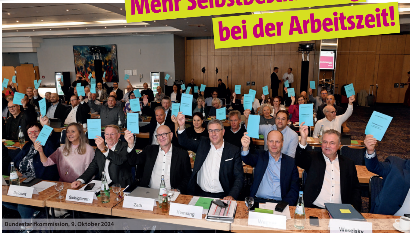
Bundestarifkommission, 9. Oktober 2024

„Ja, unsere Forderungen sind ambitioniert“, stellte dbb Chef Ulrich Silberbach auf der Pressekonferenz klar, bei der dbb und ver.di am 9. Oktober 2024 in Berlin ihre gemeinsamen Forderungen für die anstehende Einkommensrunde mit Bund und Kommunen vorstellten. „Aber sie sind keineswegs zu hoch. Sie messen sich an dem, was ein zukunftsfähiger öffentlicher Dienst braucht, und nicht an dem, was sich Bundesinnenministerin und Bundesfinanzminister sowie Stadtkämmerer wünschen würden. Wir brauchen endlich Entlastung für die Kolleginnen und Kollegen, die unser Land am Laufen halten und die Arbeit der 570.000 fehlenden Beschäftigten im öffentlichen Dienst miterledigen. Und wir müssen endlich attraktiver werden, um diese offenen Stellen besetzt zu bekommen. Wir können in der anstehenden Einkommensrunde unseren öffentlichen Dienst zukunftsfester machen, wir können aber auch die Zukunft ein Stück weit verspielen, wenn