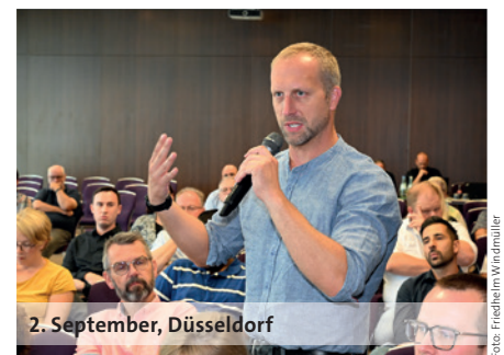
2. September, Düsseldorf