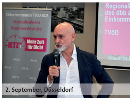
2. September, Düsseldorf