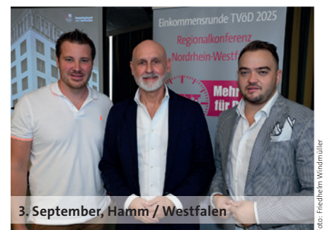
3. September, Hamm / Westfalen