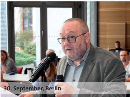
30. September, Berlin