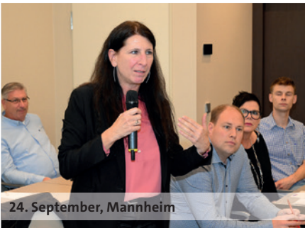
24. September, Mannheim