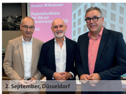
2. September, Düsseldorf