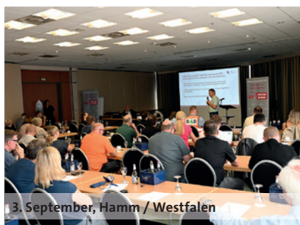
3. September, Hamm / Westfalen