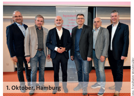
1. Oktober, Hamburg