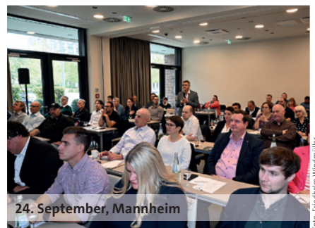
24. September, Mannheim