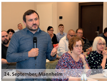
24. September, Mannheim