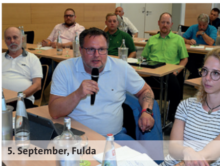
5. September, Fulda

Zentrales Ziel für die Kolleginnen und Kollegen aus Bayern, die sich am 9. September 2024 in Nürnberg trafen, bleibt eine faire und spürbare Entgeltserhöhung. Ein weiterer Schwerpunkt war der kontinuierliche Anstieg der Arbeitsbelastung in allen Bereichen des öffentlichen Dienstes. Dieser führt zu immer mehr Stress und macht langfristig krank. Hier forderten die Teilnehmenden zu Recht, dass diese Belastungen endlich ernst genommen und Maßnahmen zur Entlastung umge-