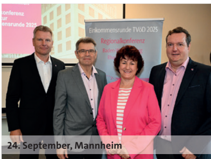
24. September, Mannheim