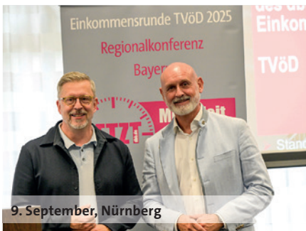
9. September, Nürnberg