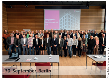
30. September, Berlin