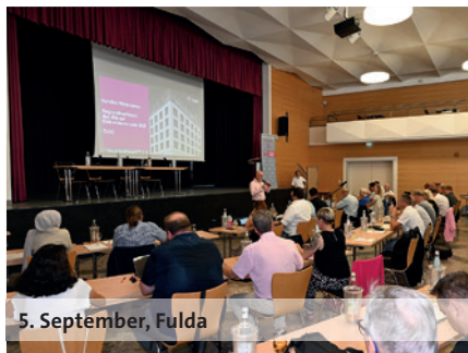
5. September, Fulda