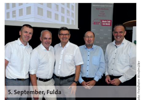
5. September, Fulda