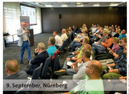
9. September, Nürnberg