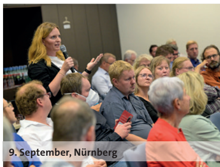
9. September, Nürnberg