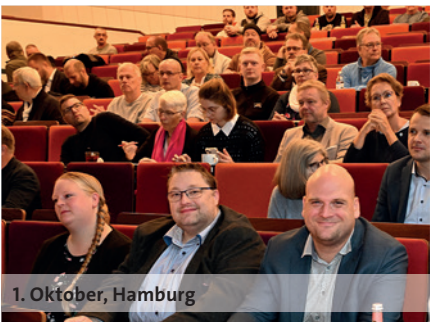
1. Oktober, Hamburg