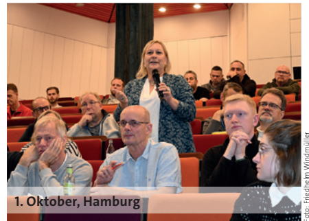
1. Oktober, Hamburg